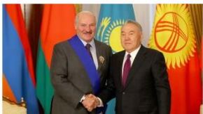
Состоялся телефонный разговор Лукашенко с Назарбаевым