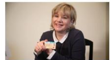
"Финансовая азбука" вместе с ОАО "Белинвестбанк": карточка ISIC – удобный сервис для учащихся