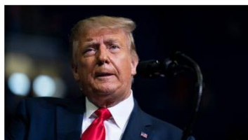
Трамп заявил о снижении смертности из-за коронавируса в США

В Киеве ослабили карантинные ограничения