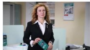
"Финансовая азбука" вместе с ОАО "Белинвестбанк": обмен валют в устройствах с функцией Cash-in