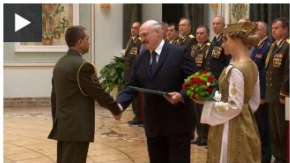
Лукашенко вручил генеральские погоны высшему офицерскому составу