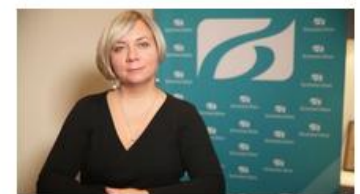
"Финансовая азбука" вместе с ОАО "Белинвестбанк": "КопилкаБИБ" - накопите на мечту

Полезная информация по правильному использованию банковских сервисов от ОАО "Белинвестбанк".