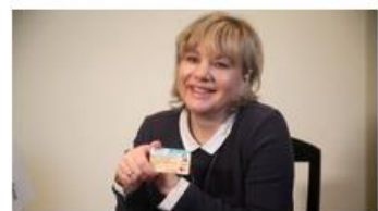
"Финансовая азбука" вместе с ОАО "Белинвестбанк": карточка ISIC – удобный сервис для учащихся