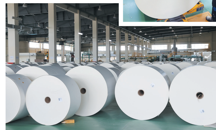
Склад хранения картона для дальнейшей переработки