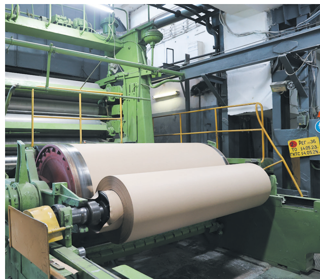
Бумагоделательная машина №3 1895 года выпуска

К сентябрю рассчитываем увеличить выпуск листового картона – идет подготовка к вводу в эксплуатацию станка форматной резки (1700 мм) производительностью от 50 тонн в сутки. Закупаем экструзионный ламинатор производительностью 20 тонн в сутки. Толщина ламинирования на основе из бумаги или картона от 10 до 80 мкм. Ориентировочный срок ввода в эксплуатацию – четвертый квартал 2023 года.