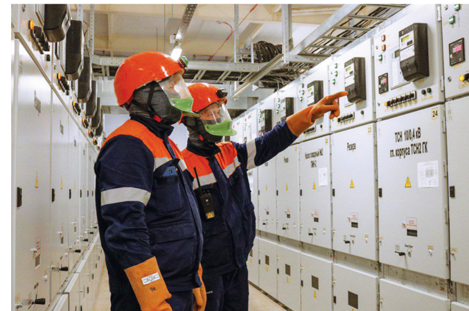
На объектах РУП «Минскэнерго»