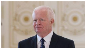
Мигаш: Беларусь и Словакия могут удвоить товарооборот

Беларусь поднялась на 18-е место среди 166 стран в рейтинге достижения ЦУР