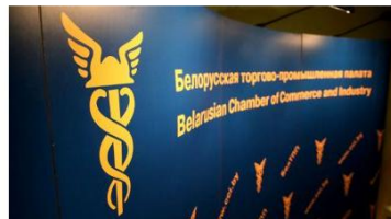
БелТПП и Беларусбанк подписали меморандум о совместной поддержке экспорта на 2020-2021 годы

В Беларуси разработаны проекты изменений в госстандарты на спа-услуги