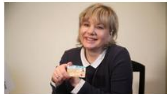
"Финансовая азбука" вместе с ОАО "Белинвестбанк": карточка ISIC – удобный сервис для учащихся