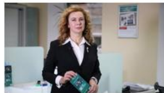
"Финансовая азбука" вместе с ОАО "Белинвестбанк": обмен валют в устройствах с функцией Cash-in