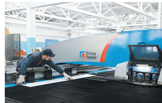
Изготовление деталей на координатно-револьверном пробивном прессе

Дезинфекция лифтовой кабины проводится ультрафиолетовым излучением в диапазоне В и С, что позволяет уничтожить все вирусы, бактерии, грибки, а также различные мутации патогенных микроорганизмов. Высокую эффективность разработки подтвердили