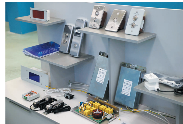
Электрооборудование для лифтов

В отличие от кварцевых и бактерицидных ламп в процессе работы система дезинфекции не выделяет