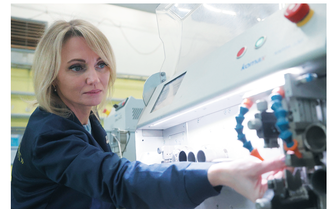
Автоматическая мерная резка и зачистка проводов

озона, что подтверждает гигиеническую безопасность и возможность применения системы в кабинках лифтов поликлиник, больниц, торговых центров, государственных учреждений и других мест с высокой посещаемостью, а также для любых других лифтов.