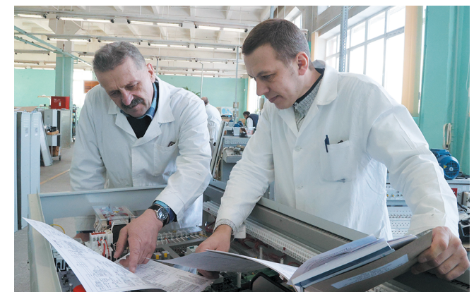
Испытание устройства управления лифтом на стенде прогона

Сегодня на ОАО «Зенит» трудится порядка 1 тыс. человек. И каждый из них вносит свой весомый вклад в создание высокотехнологичной и востребован-