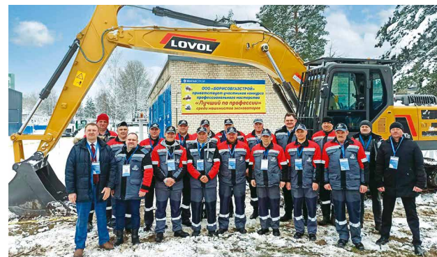
Конкурс «Лучший машинист экскаватора»

На республиканском конкурсе «Компетентность – 2022» победителем в номинации «Лучшая испытательная лаборатория» признан Инженерно-технический центр ОАО «БЕЛГАЗСТРОЙ» – управляющая компания холдинга»