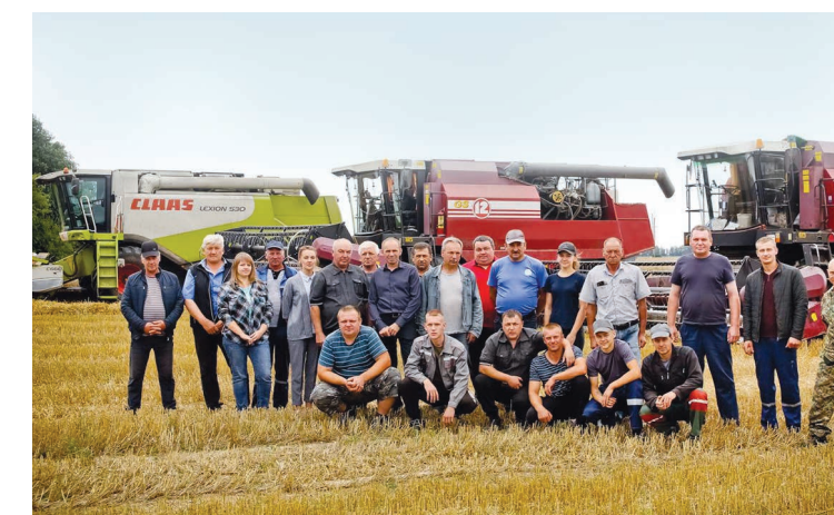
Герои жатвы ОАО «Семежево»