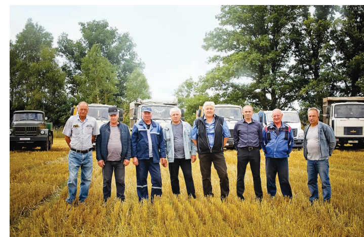
Благодаря таким преданным своему делу труженикам хозяйство добивается успехов

– Там уже нечего модернизировать, надо строить новые с помощью государства, – открывает планы директор ОАО «Семежево» и надеется, что с нынешним коллективом