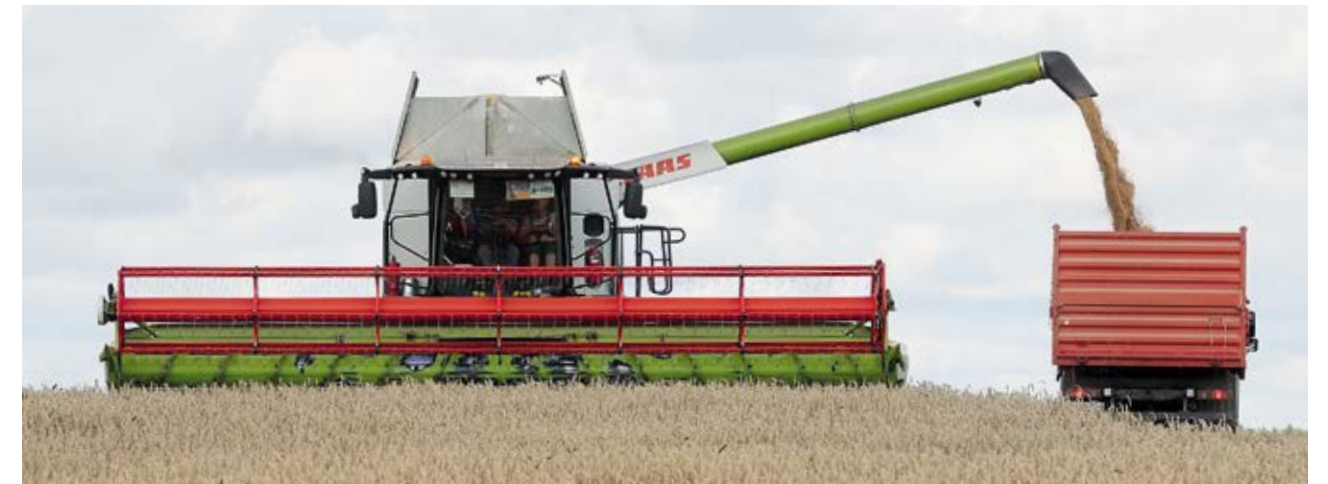
Уборка пшеницы на полях СПК «Свитязянка-2003»

– Озимый ячмень, потом яровой, после – стали убирать: рапс, озимую пшеницу, тритикале. Больше всего, конечно, мне нравится убирать пшеницу. Урожай в этом году в целом хороший, – за сезон, как подсчитал комбайнер, ему удалось намолотить более 3307 т зерна нового урожая.