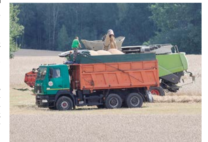
Урожай зерновых выше прошлогоднего на 800 т

Естественно, работают аграрии СПК «Свитязянка-2003» с заделом и на будущий год. Например, основную массу рапса, а культура занимает 600 га, здесь сеют с применением технологии strip-till. Начали тестировать еще четыре года назад и могут основательно оценить